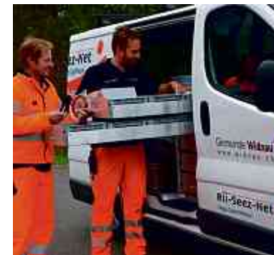
Die örtlichen Kabelnetzmitarbeiter wissen Bescheid und sind im Nu vor Ort.

Swisscom schaltet das analoge Telefon und die ISDN-Anschlüsse Ende 2017 ab. Die klassische Telefonbuchse wird überflüssig: mit der Kabeldose von Rii-Seez-Net kein Grund zur Sorge. Via Kabelnetz können Sie schon jetzt telefonieren und Geld sparen. Ihre alte Telefonnummer dürfen Sie behalten. Rufen Sie einfach den örtlichen Kabelnetzmitarbeiter Ihrer Gemeinde an oder Rii-Seez-Net in Buchs. Sie wissen Bescheid.