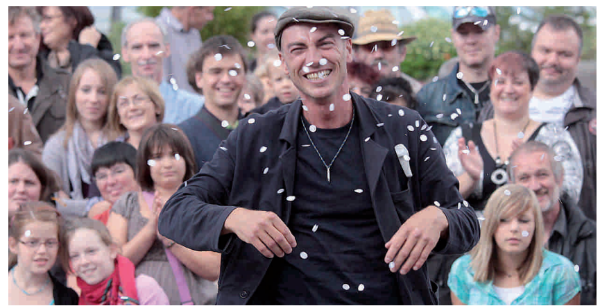
Die besten Strassenzauberer der Welt begeistern das Vaduzer Städtle.

Staunen, Spass haben, lachen laut die Devisen am Sonntag, 15. Mai. Sieben der besten europäischen Strassenzauberer unterhalten Klein und Gross den ganzen Tag. Eine solche Veranstaltung hat die Region noch nie erlebt. Die Magier werden mit ihren urkomischen Shows eine ganz besondere, lustige Atmosphäre ins Städtle zaubern. Mit dabei ist auch der amtierende Weltmeister aus Turin: Trabük. Er gewann weltweit die höchsten Auszeichnungen wie «Monaco Magic Day», «Colombe d'Or», und als Höhepunkt wurde Trabük 2010 in St. Wendel